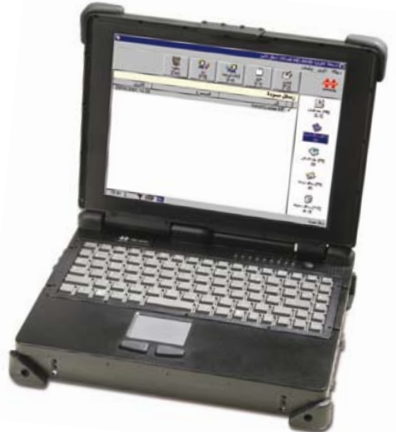
Crypto Field Terminal HC-6830

إن تبادل المعلومات الرقمي في إطار مبدأ العملية المعتمدة على الشبكة هو حالياً واقع؛ تعتمد العمليات العسكرية والإجراءات الأمنية وعمليات عناصر الحماية أو الأمان بشكل متزايد على وحدة أدوات الاتصال المتشابهة. وتضمن اليوم إمكانية إعطاء الأوامر والتحكم الرقمية السلسلة نجاح كل عملية، بحيث يمكن اتخاذ القرارات المهمة في هذا المجال والمتعلقة بالعملية والقيام بتبادلها بين القيادة والقوات بقدر عالي من أمان الاتصالات. ولذا يُعتبر Crypto Field Terminal HC-6830، والمُعد للاستخدام في الظروف القاسية، عنصراً مركزياً